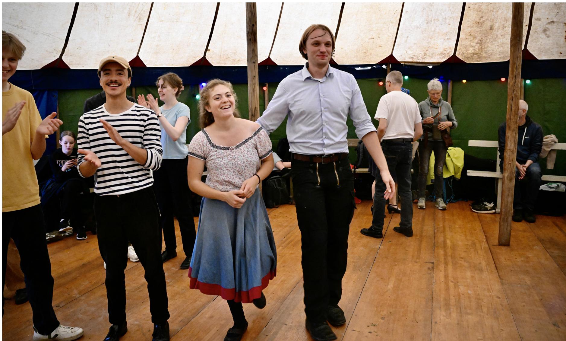
Skratt och musik ekade genom skogen i helgen. I tretakt stampades och dansades det när Ornungastämman började med en workshop i fläckpolska på lördagen.